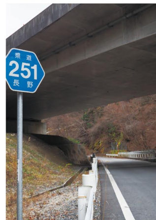
喬木村氏乗の三遠南信自動車道矢管トンネル出口上