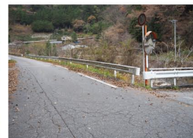
起点の飯田市上村上町、国道256号交点