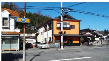
終点のJR飯田線元善光寺駅前

昭和50年代には上南信濃両村の手でガードレール設置などの整備が進みました。そして57年3月、林野庁との協議で村道に認定され同年7月に県道に認定されました。