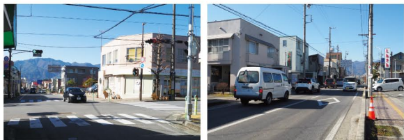
終点の飯島飯田線交点