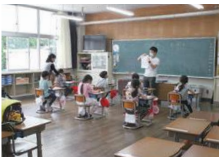
座光寺小学校分散型登校の様子