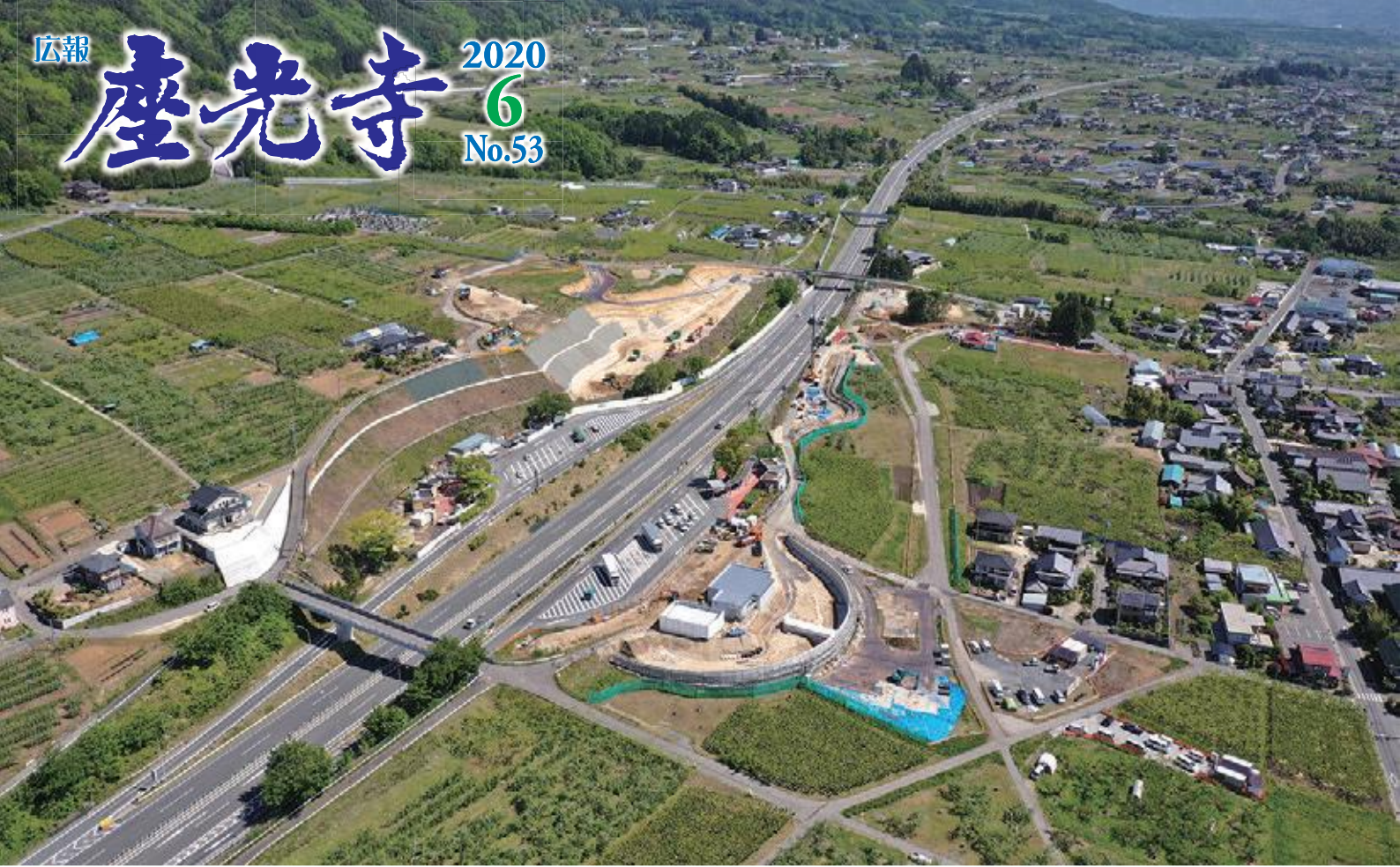
撮影日：令和2年5月14日