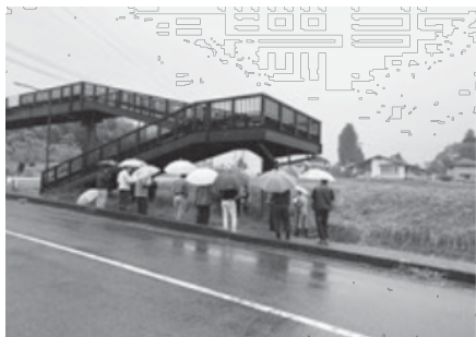
現地付近で行われた説明会の様子

リニア関連工事で、多くの方が移転を迫られるなかで、その全ての皆さんが、座光寺地域に再び住んでほしいという願いのもと、警察官舎においても、座光寺地域内へ移転してもらおうよう、市政懇談会など様々な機会をとらえて行政に要望を行ってきました。現在、官舎の移転に向け調整が進められており、万才地