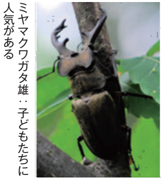
ミヤマクワガタ雄…子どもたちに人気がある

クワガタムシやカブトムシは夜間によく活動し、樹液の出るところに集まります。そのため早朝に樹液が出る樹のいわゆる「昆虫食堂」を探します。夜間に樹液に集まった昆虫が残っているのです。樹液には他にカブトムシ、カナブン、ケシキスイ、オオムラサキ、スズメバチ等の虫が集まっています。昔の子どもたちは歩いて樹液を探しましたが、最近では親と一緒に車で樹液を巡ります。虫たちはたまったものではありません。