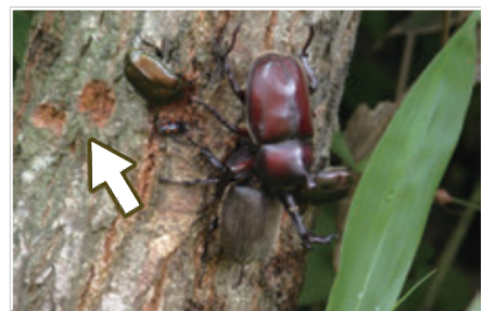
左上にある黄褐色の斑点(矢印)がシロスジカミキリの産卵痕

樹液を出す樹はクヌギ、コナラなどのナラ類でどんぐりがなる樹です。表皮の下にある形成層の師管からブドウ糖やデンプンを含んだ液がでます。夏の暑さでこれらの樹液は発酵し、良い匂いを出しています。この匂いに誘われて昆虫がやってくるのです。シロスジカミキリの幼虫が好むのは直径30cmほどの樹で、親は40cmを超えるような太い樹には産卵しません。