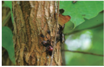
昆虫食堂：染み出た樹液が発酵して良い匂いが出ている。ここにはカナブンとコムラサキチョウ等が集まっている

とところが近年、この昆虫食堂が少なくなりました。これは樹液を出す樹が少なくなってきたからです。樹皮に最初に傷をつけることは多くの昆虫類にはできません。樹液の