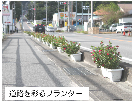
道路を彩るプランター