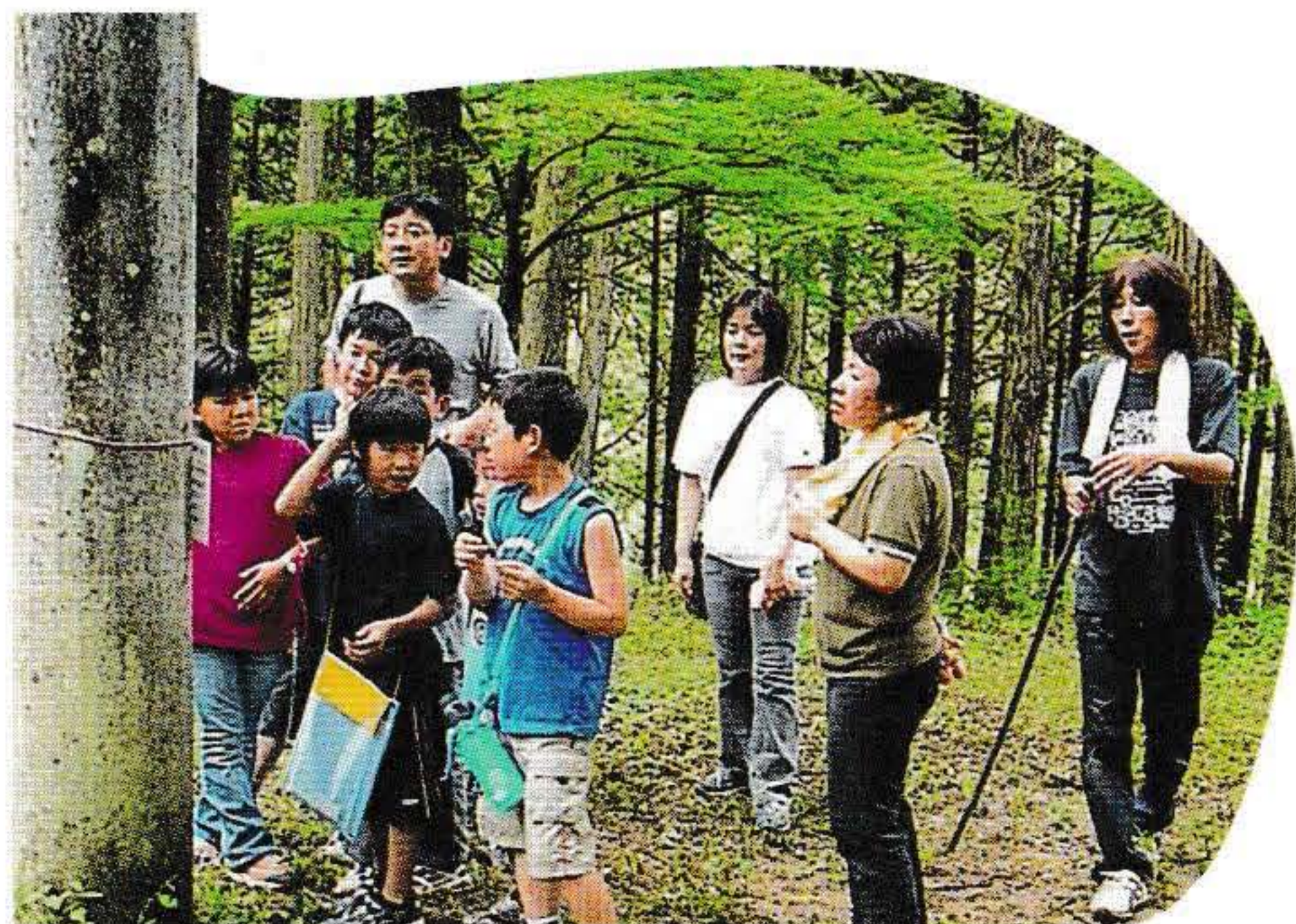
親子レクでウォークラリー

南本城を探検してコースを作り、チェックポイントを決めて問題を考えました。そして小学校の人たちや保護者や地域の方たちと、ウォークラリーを楽しみ